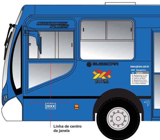
Linha de centro da janela