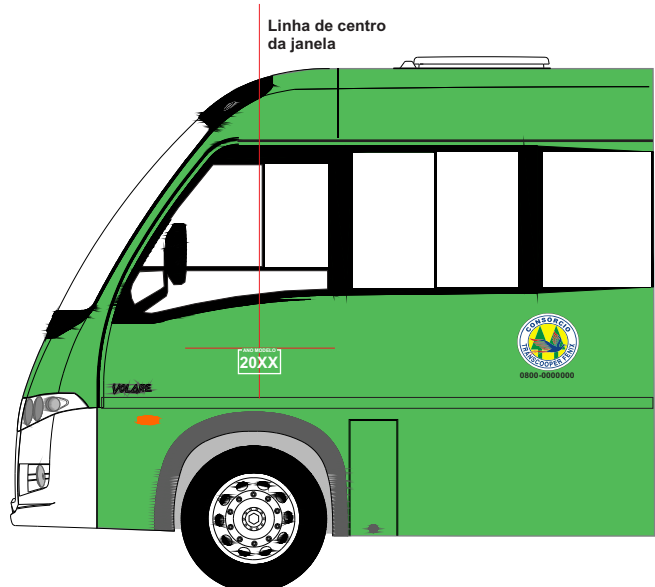
Linha de centro da janela

OBSERVAÇÃO: Informação obrigatória para todos os veículos com carrocerias fabricadas a partir de Janeiro de 2006.