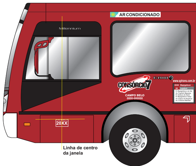
Linha de centro da janela