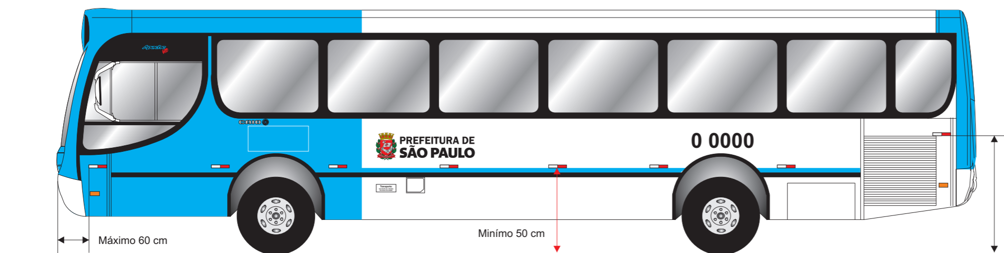
Vista lateral esquerda