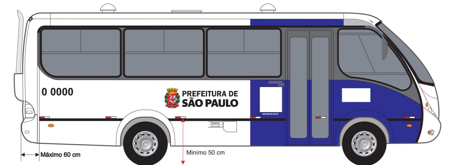
Vista lateral direita