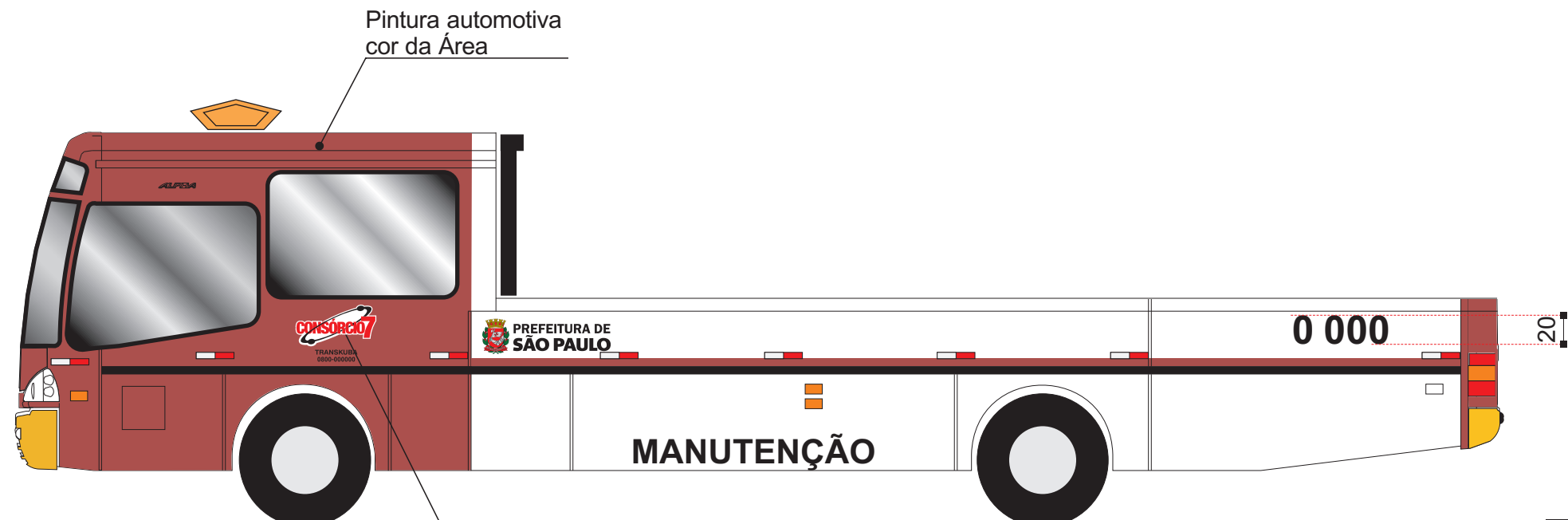
Vista lateral esquerda