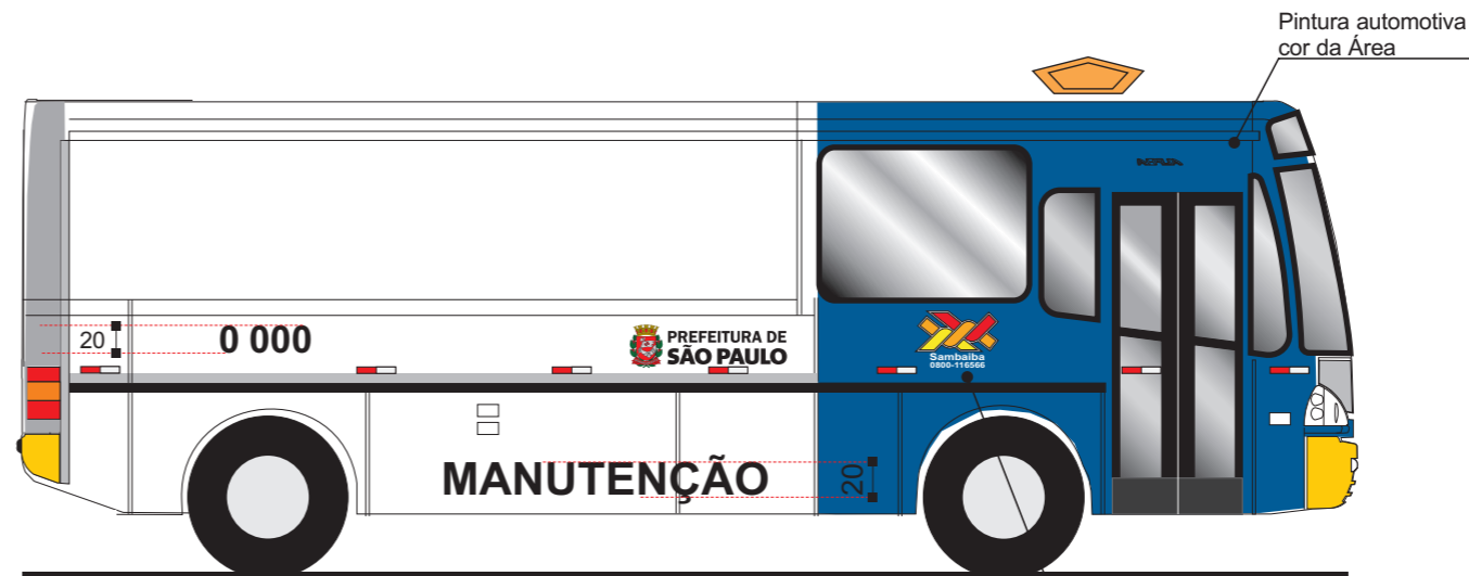
Vista lateral direita