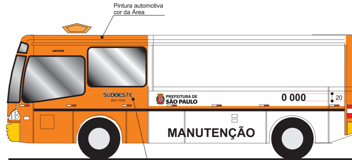
Vista lateral esquerda