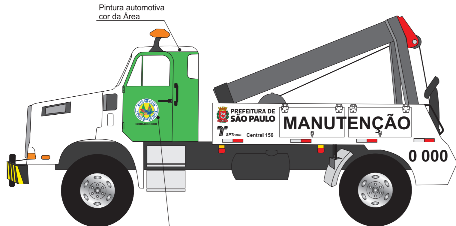
Vista lateral esquerda

Identificação do Consórcio e telefone 0800