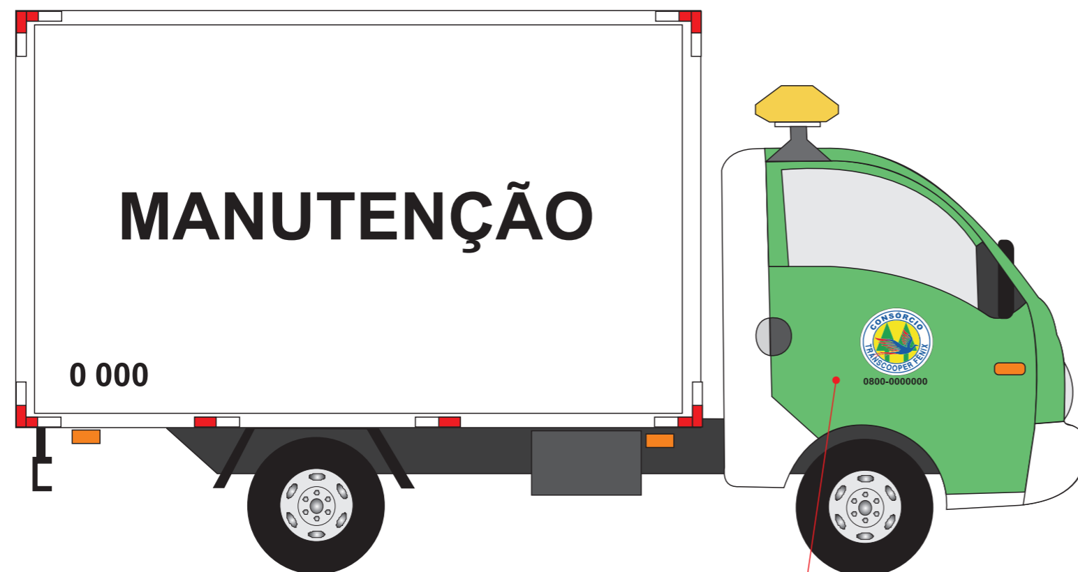
Identificação do Consórcio e telefone 0800