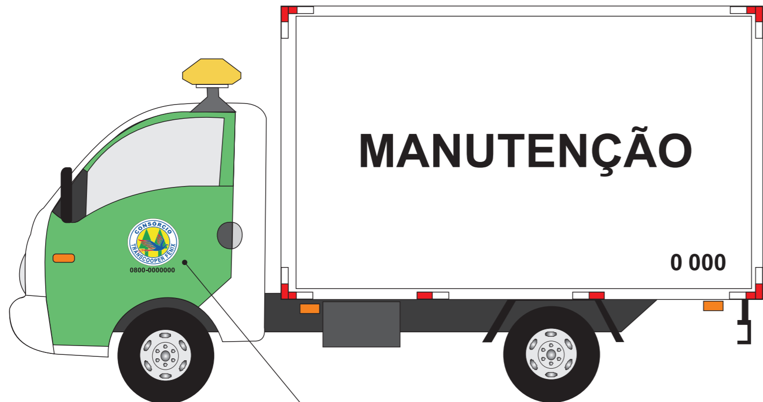
Identificação do Consórcio e telefone 0800