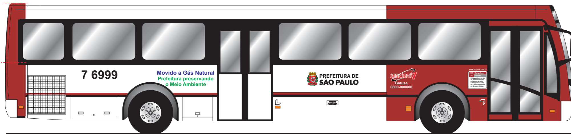
Vista lateral direita

Esta folha é propriedade da SÃO PAULO TRANSPORTES S.A. e seu conteúdo não pode ser copiado ou revelado a terceiros. A liberação ou aprovação deste Documento não exime a projetista de sua responsabilidade sobre o mesmo.