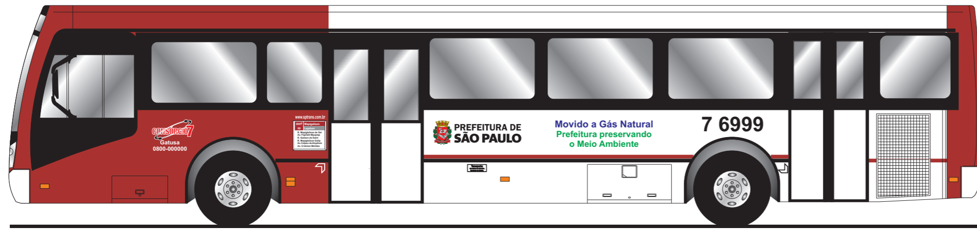
Vista lateral esquerda