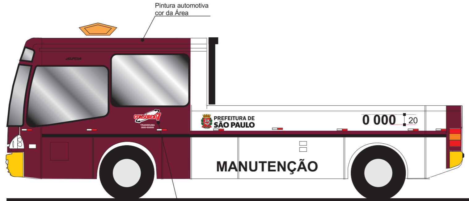
Vista lateral esquerda