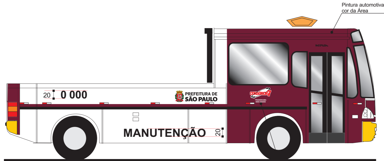
Vista lateral direita